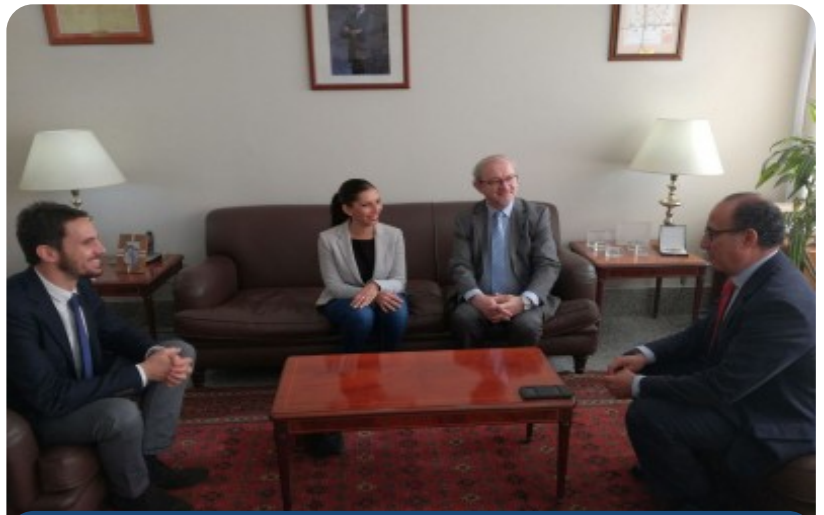
Por ejemplo, en Melilla han "vaciado" el centro de forma irregular

Estos trabajos, tan necesarios y urgentes como hemos convenido todos en el comité, han ido hasta ahora bastante lentos por distintas razones. Desde CGT hacemos un llamamiento a ponernos todos las pilas en este tema porque con esta dirección cada día que pasa la situación se agrava.