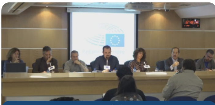
Presentación de la iniciativa

CGT participó este viernes en la presentación de una propuesta de Podemos en el Parlamento Europeo, junto a organizaciones de la sociedad civil y otros sindicatos de RTVE como CCOO, UGT y USO. La formación morada va a preguntar en Bruselas sobre la falta de independencia y la manipulación en RTVE, y ya ha obtenido el apoyo de eurodiputados de otros partidos. CGT hemos denunciando siempre la manipulación y apoyaremos todas